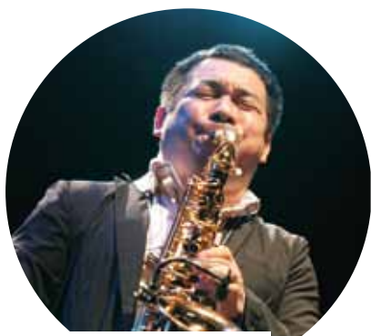
KOH MR. SAXMAN - SAXÒFON - TAILÀNDIA