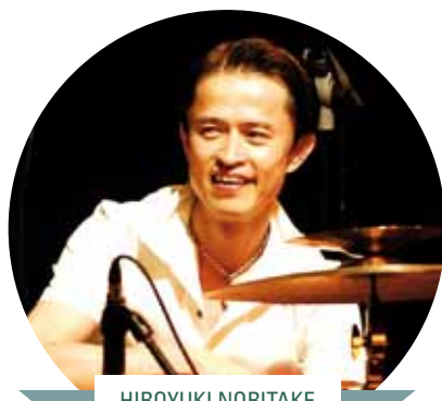
HIROYUKI NORITAKE - BATERIA - JAPÓ